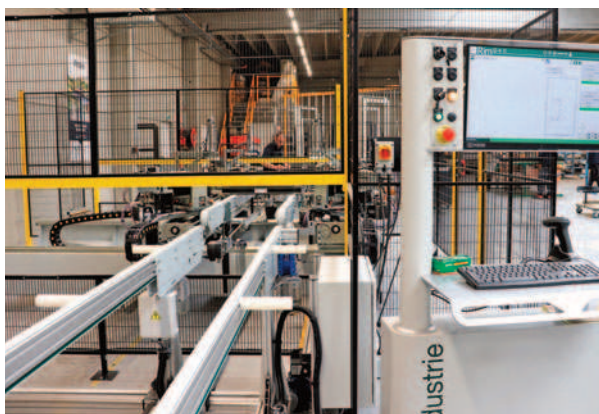
Cette sertisseuse FOM installée début avril 2024 améliore la qualité et la productivité.