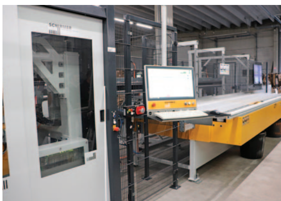
Le centre de débit-usinage PVC Schirmer installé en 2023.

Attentive à cultiver une grande proximité avec ses clients, Ouvêo Hauts-de-France les a invités à découvrir le nouveau show-room et les derniers aménagements intervenus dans l'usine lors d'une journée portes ouvertes le 19 avril dernier. « Nos clients, dont environ 500 sont des partenaires actifs, sont des acteurs régionaux de différentes tailles, essen-