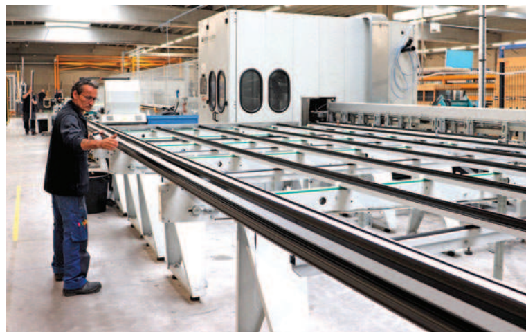
Centre de débit-usinage alu FOM (déplacé du site Ouvèdo d'Aquitaine).