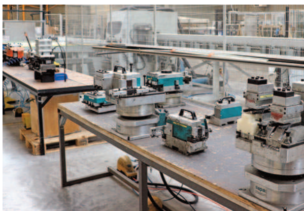
Zone de poinçonnage.