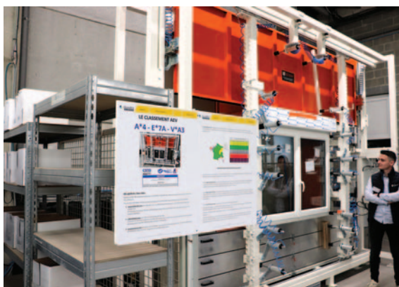
L'usine renforce l'étape de contrôle et la certification de ses produits, qui est gérée par Arthur Chœur, jeune responsable QSE embauché en 2023, lorsque sont arrivés les deux bancs d'essai : ici le banc AEV pour les menuiseries (deux sont testées par mois).