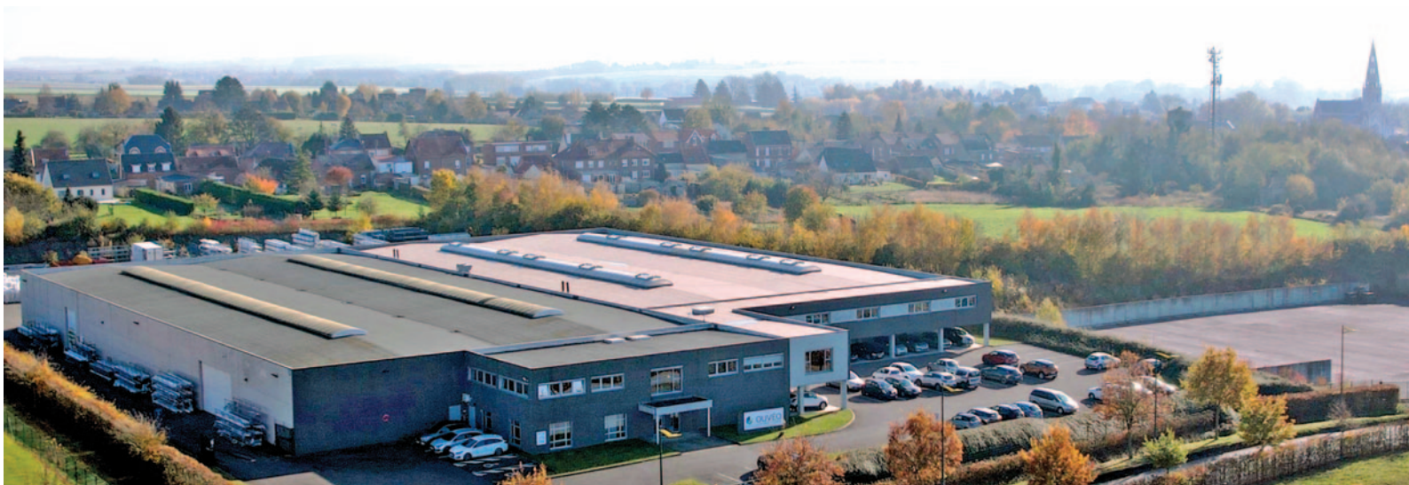
Le site d'Ouvéo Hauts-de-France : deux halls de production contigus qui totalisent 7 000 m 2 couverts.

millions d'euros, avec une contribution de la Communauté d'agglomération du Cambrésis et de la Région Hauts-de-France à hauteur de 100 000 euros chacune.