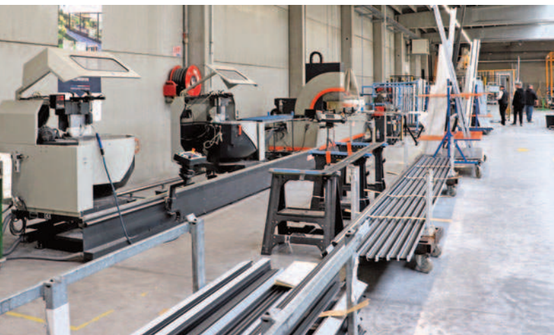
Zone de débit et usinage des barres d'aluminium, fournies en 1,5 mm d'épaisseur par Cortizo.